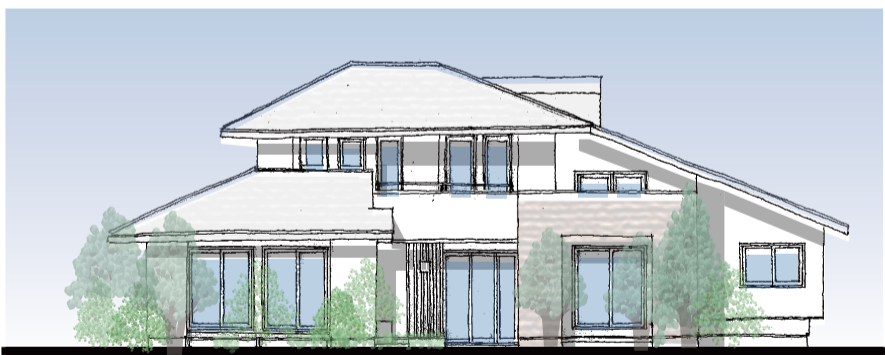
南立面図の考え方 既存の住宅デザインのおおらかな気持ちの良い大屋根のイメージを残しながら落ち着いた外観デザインとします。